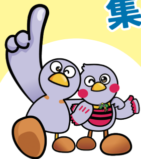
さいたまけん 埼玉県マスコット 「コバトン」「さいたまっち」

けん しまわ にほんいちく さいたまけん 県では、こどもの幸せにつながる日本一暮らしやすい埼玉県をつくるために、