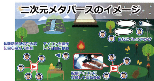
二次元メタバースのイメージ