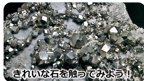
きれいな石を触ってみよう！