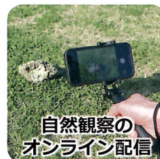
自然観察のオンライン配信