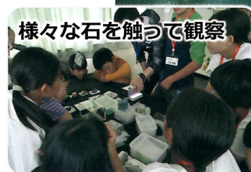
様々な石を触って観察