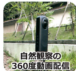
自然観察の360度動画配信