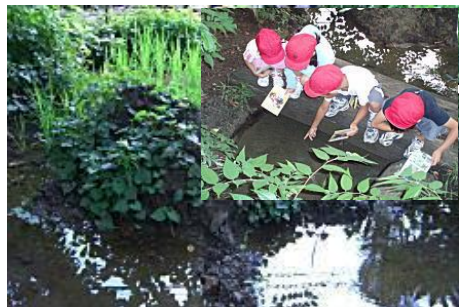
「日本一のピオトープでの環境学習」