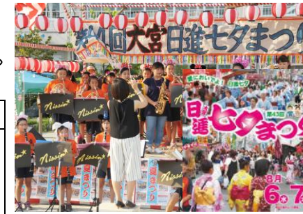
「2016 第45回 日進七夕まつり」