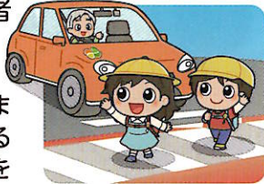
横断歩道は歩行者優先

横断歩道は歩行者優先です。運転者には横断歩道手前での減速義務や停止義務があります。歩行者の横断を妨げないようにしましょう。歩行者や他の車両に対する「思いやり・ゆずり合い」の気持ちを持って運転しましょう。