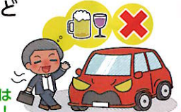
飲酒運転は絶対ダメ！

飲酒運転やあおり運転（妨害運転）は極めて悪質で危険な犯罪です。アルコールは少量の摂取でも安全運転に必要な情報処理能力、注意力、判断力などを低下させ、交通事故の危険を高めます。お酒を飲んだら絶対に車を運転してはいけません。あおり運転もやめましょう。